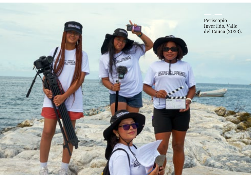
Periscopio Invertido, Valle del Cauca (2023).

Periscopio posibilita el fortalecimiento de las intersensibilidades de la resistencia como base para la creación de otros futuros posibles.